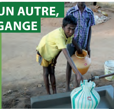
Enfants se servant pour la première fois du robinet, juste rénové. Village de Seepalakottai – Inde. Automne 2011.

Les 2€ de la solidarité récoltés pendant la 11 e édition du festival de l'Oh ! ont permis