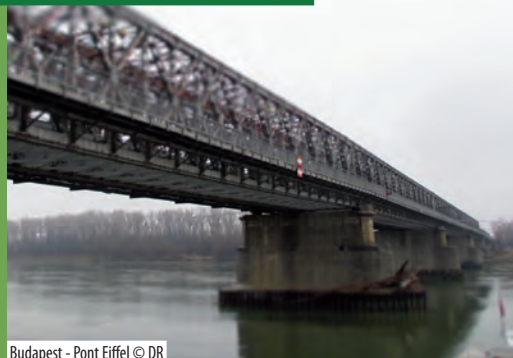
Budapest - Pont Eiffel

Le Danube est à la fois frontière et ressource commune. La question de sa gestion à l'échelle globale est aujourd'hui un enjeu majeur pour prévenir les risques environnementaux. Des programmes transnationaux de préservation des rives sont aujourd'hui expérimentés. A ce titre, l'exemple danubien pourrait être un modèle pour d'autres processus de coopération fluviale.