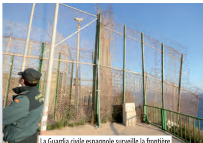
La Guardia civile espagnole surveille la frontière hispano-marocaine à Melilla, enclave espagnole située au Maroc – Mars 2012.

En Europe, la mise en place de l'espace Schengen, à la fin des années 1980, a conduit à un effacement progressif des contrôles frontaliers entre les états membres tandis que le contrôle de la frontière européenne extérieure se renforçait. Ce processus s'est traduit par un transfert des contrôles des migrants à des pays périphériques ou limitrophes. Ce processus s'est d'abord opéré au Sud, sur les côtes méditerranéennes maghrébines, dans les années 2000, avant de s'étendre à l'Est, dès 2004. Parfois, ce travail est délégué à des entreprises privées. Les premières victimes restent toujours les migrants, confrontés à la violence et à la répression.