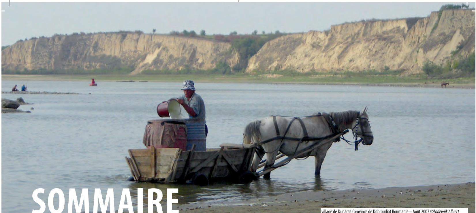
village de Dunărea (province de Dobroudja) Roumanie – Août 2007