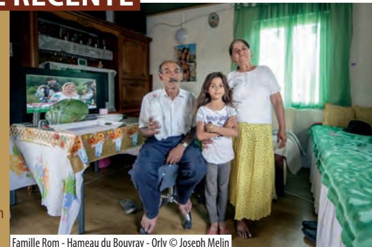
Famille Rom - Hameau du Bouvray - Orly

22 ans après la chute des régimes communistes, que sont devenus les millions de Roms qui habitaient ces pays - Bulgarie, Roumanie notamment ? La période post-communiste a profondément ébranlé les modes de vie hérités des générations précédentes. L'irruption du libéralisme a tracé des chemins que certains ont suivis, en devenant d'excellents entrepreneurs par exemple. Nombre d'entre eux se sont accommodés au nouveau système et ont grossi les rangs de la classe moyenne, déjà établie