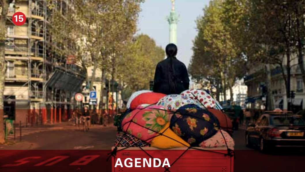
▼ Bottari Truck-Migrateurs Kimsooja Bottari