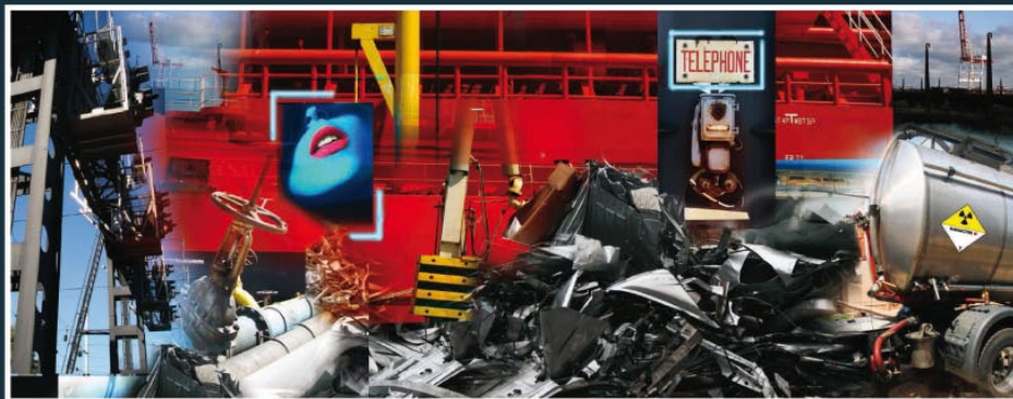
Lost landscape n°18, de Peter Klasen (2012)

Du 26 août au 26 septembre – Place Pierre-Sémard – Renseignements au 01 43 98 67 71