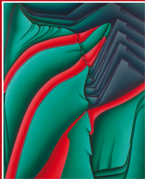
Ruduvius personatus , de Jacques Poli (1978) HV spécial sur toile cirée, 162 x 130 cm

Du 11 au 25 septembre – Salle des fêtes de l'hôtel de ville