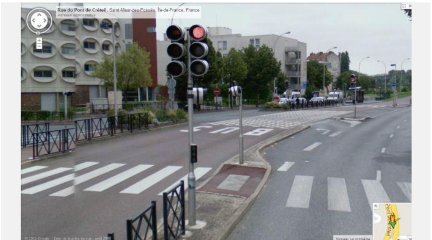
Tourne à Gauche voiture en lieu et place d'un refuge piéton digne de ce nom : les piétons se font tanner par les TVM et autres bolides. Refuge piéton insuffisant en largeur et longueur, et dépourvu de barrières !