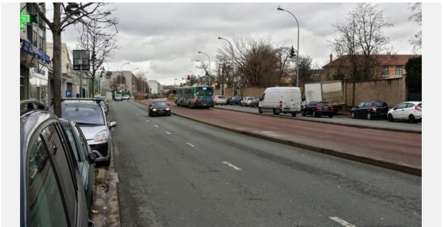
Vue générale : 6 voies voitures (4 de circulation, 2 de stationnement) pour 0 piste cyclable, et absence regrettable de barrières pour canaliser les traversées piétonnes.