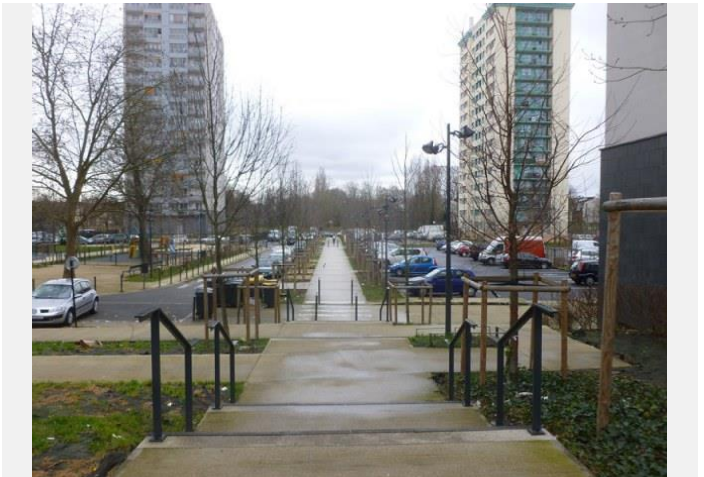
Prolongement Passage piéton manquant vers la Marne Axe Villa Vernier Gymnase d'Arsonval Chalets