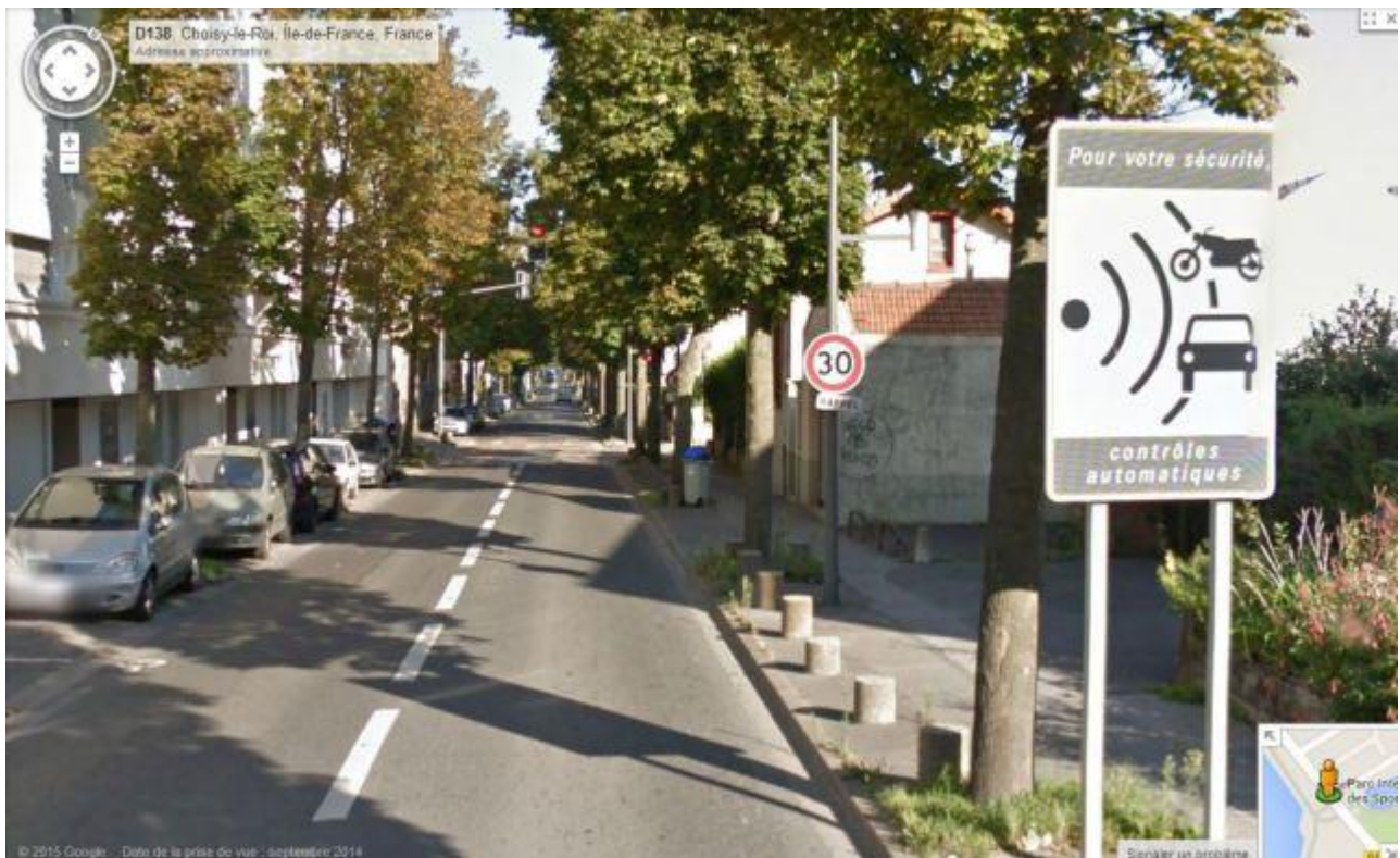
30 km/h maxi, sinon ça flashe : la culture du résultat. Exemple sur la D138 à Choisy le roi