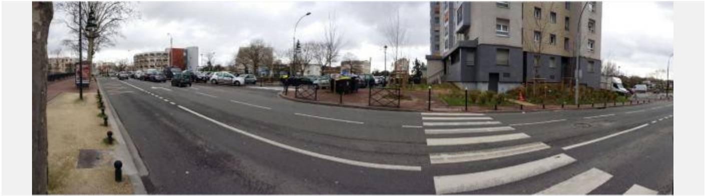
Bas de la rue du Chemin Vert, près de la Marne : Manque 1 passage piéton surélevé pour aider à faire respecter la priorité piétonne.