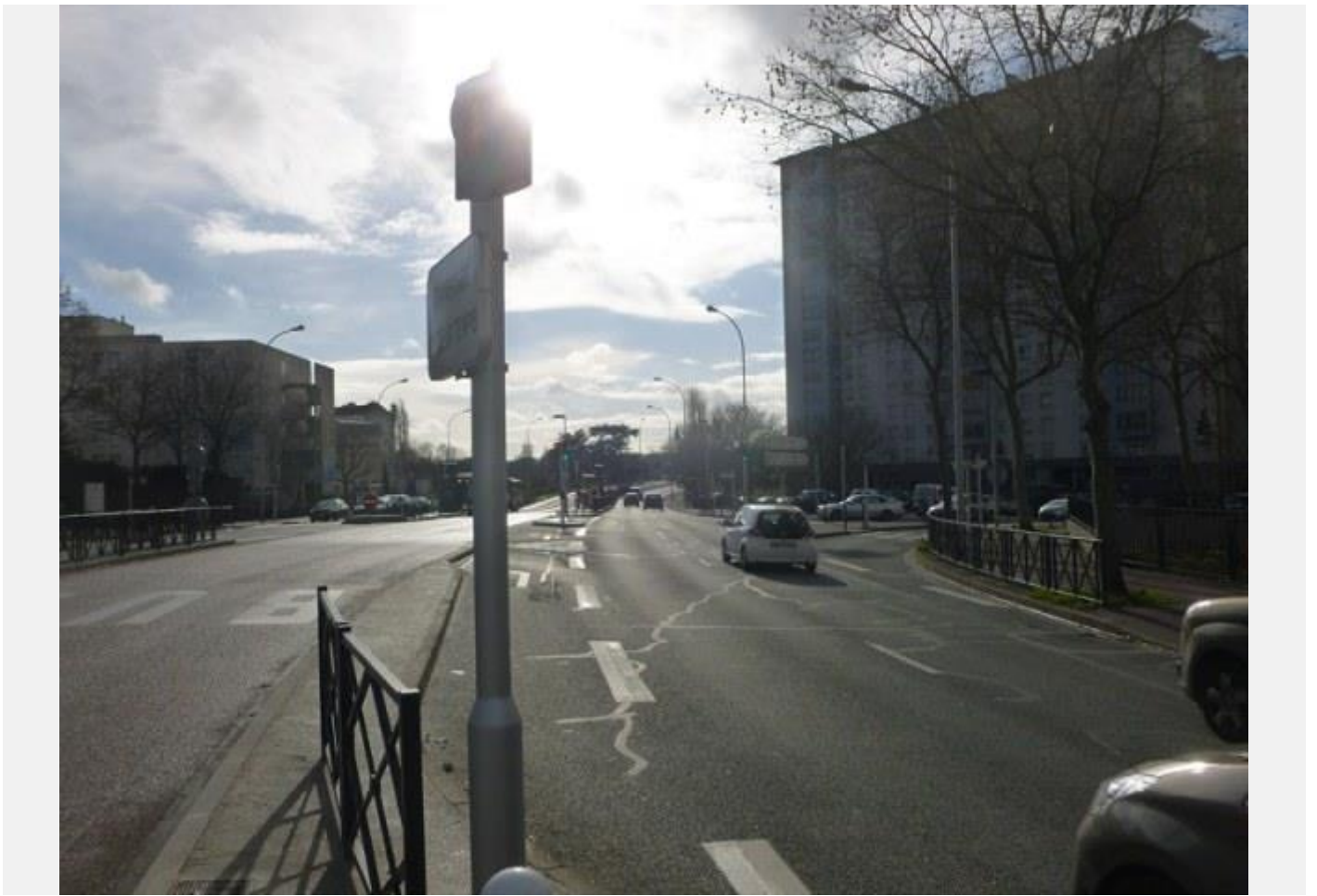
Vue du tourne à gauche démesuré, en tant que piéton : au milieu de nulle part, du bruit et de la fureur