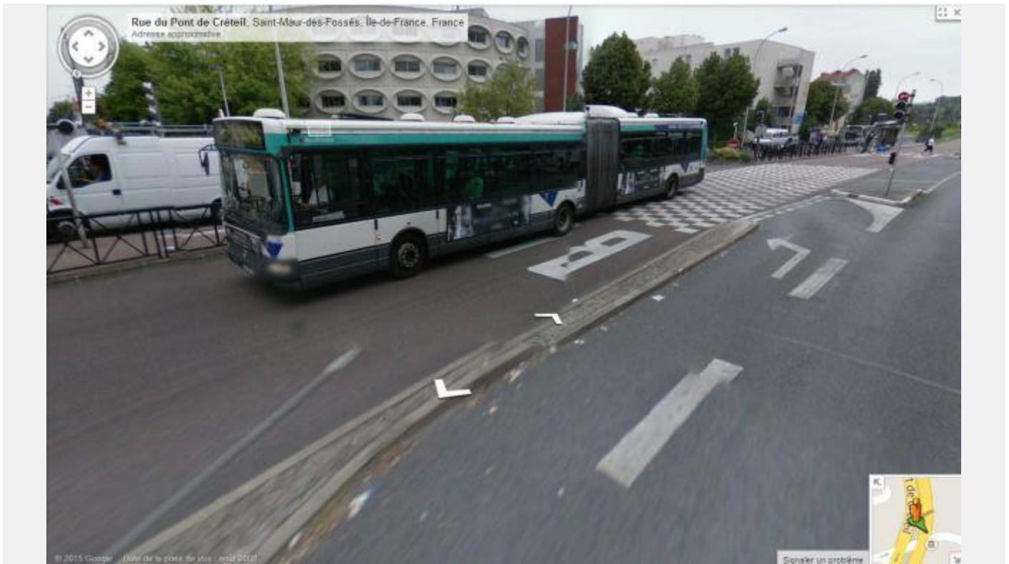
Tourne à gauche : voitures au détriment de la sécurité des groupes de piétons