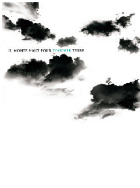
Chen Jia yin, Taipei, 2 ème prix ex aequo

Affiches sélectionnées pour figurer sur nos cartes postales