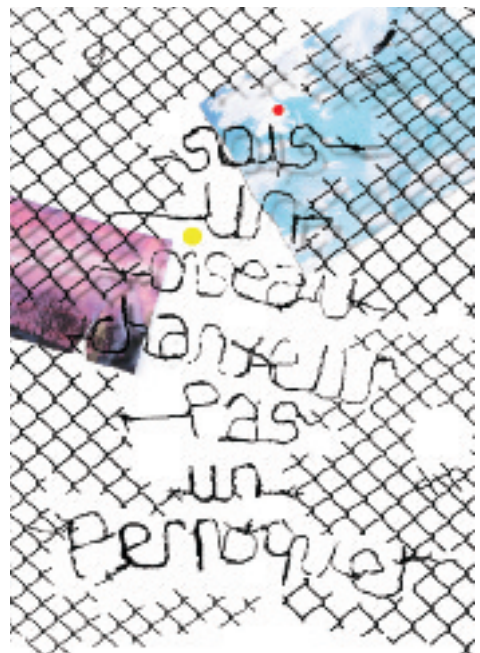
Leung Sherly, 2 ème prix ex aequo