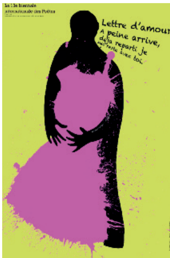
Fan Liu, Pékin, 2 ème prix ex aequo

Affiches sélectionnées pour figurer sur nos cartes postales