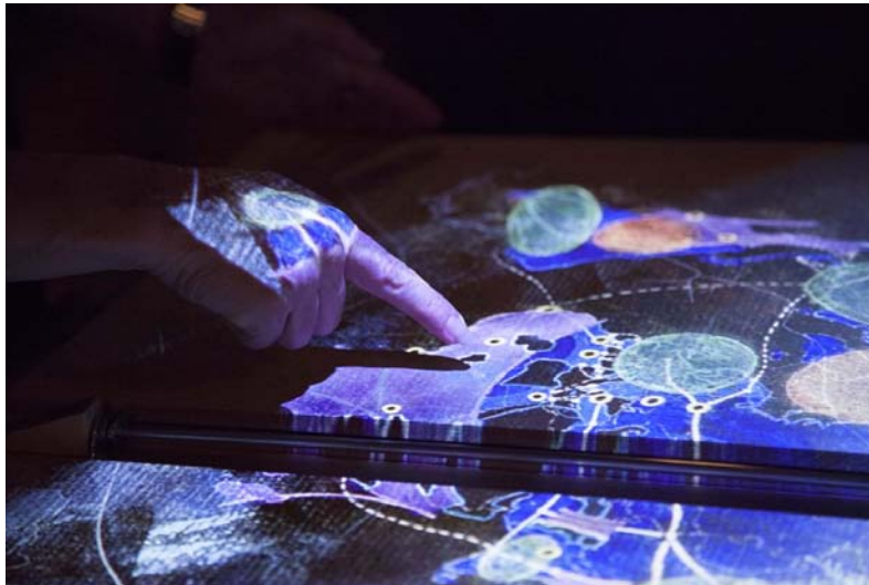
Moving Beyond Borders