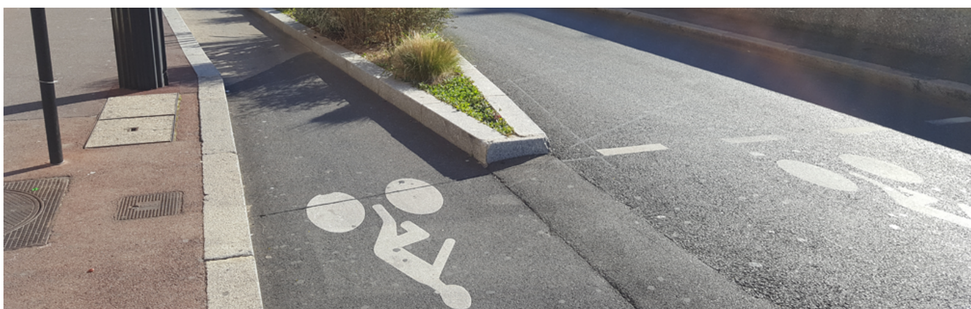
Piste cyclable RER Joinville