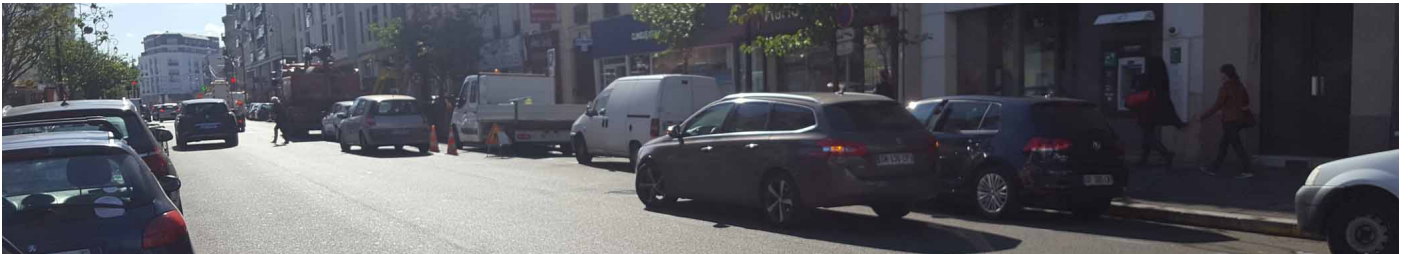
Rue de Paris