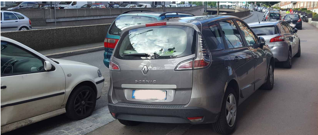
Rue Jean Mermoz