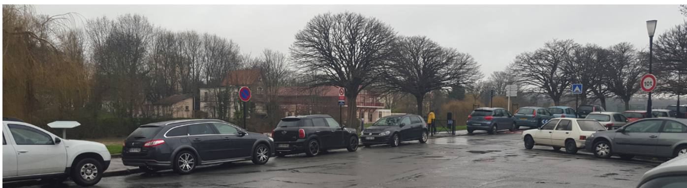
Place Bergisch Gladbach