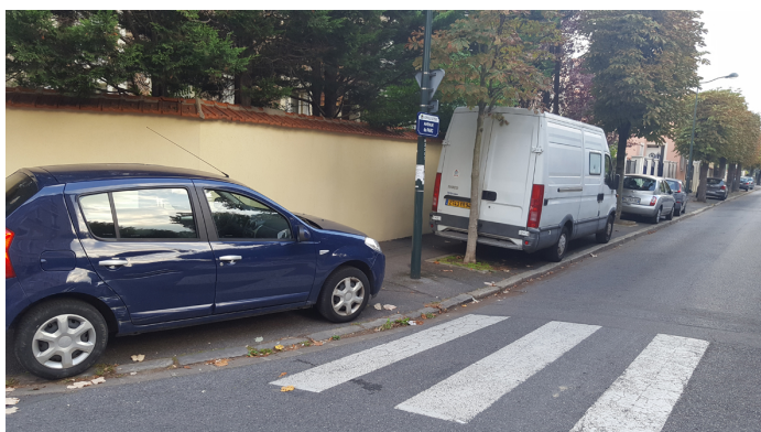
Rue du Parc