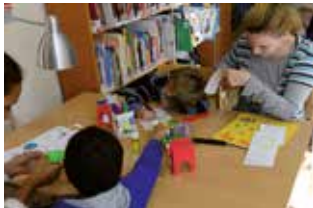
O. de Banes