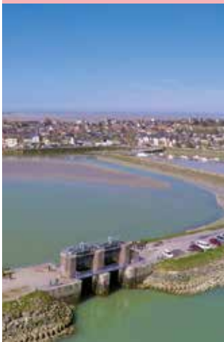
OT Le Crotoy

Infos, inscription et tarifs : page 6 - service des sports, de la vie associative et des loisirs