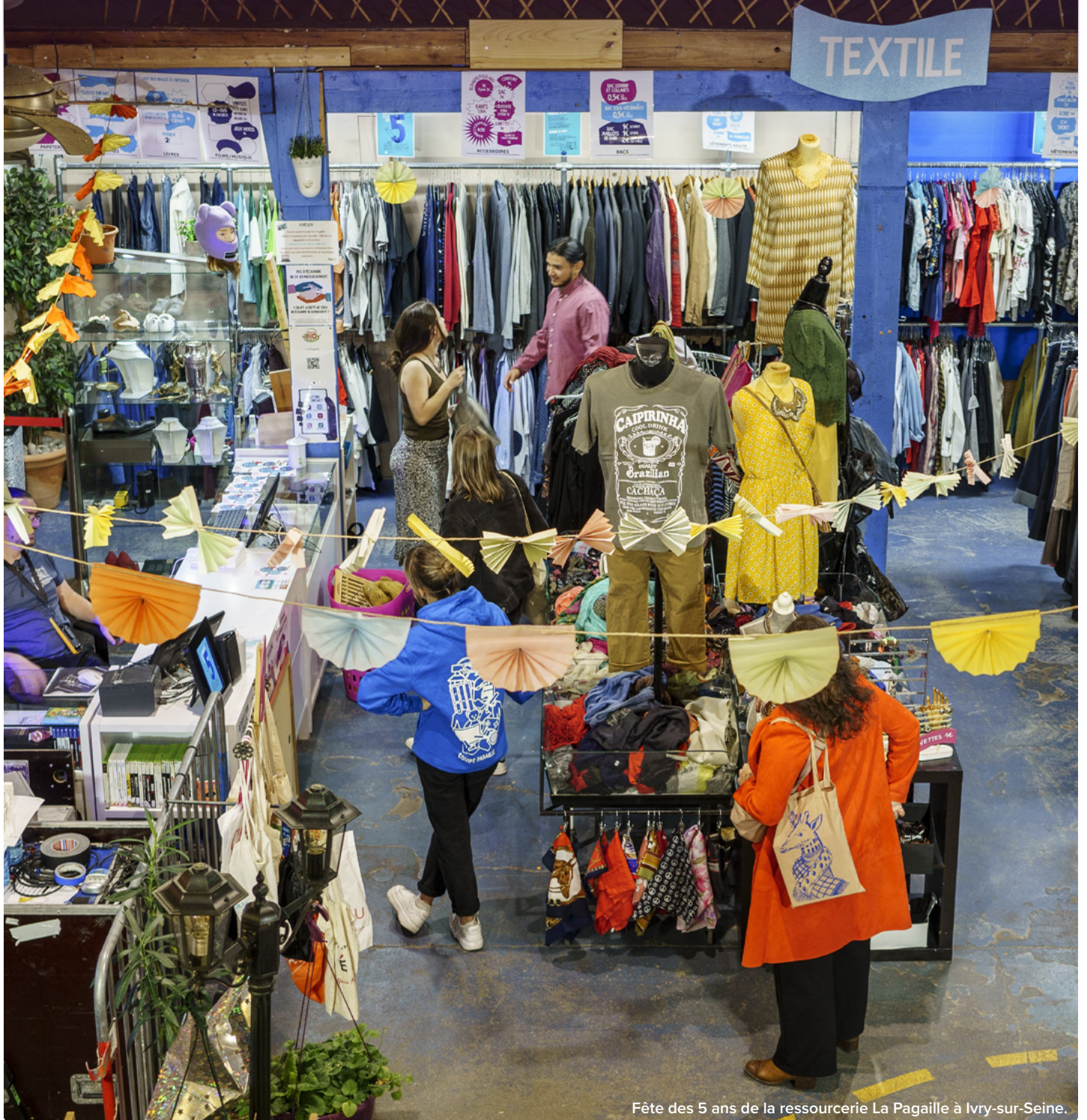
Fête des 5 ans de la ressourcerie La Pagaille à Ivry-sur-Seine.