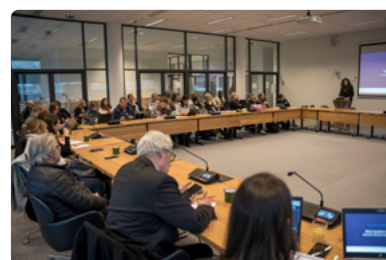
Matinale des achats responsables du Grand-Orly Seine Bièvre 2022.

La prochaine se tient le jeudi 9 novembre à 9 h à 12h30 au siège du Grand-Orly Seine Bièvre à Orly.