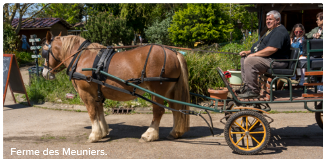
Ferme des Meuniers.

Organisé chaque année depuis 2018, l'appel à projets ESS du territoire Grand-Orly Seine Bièvre encourage les structures dans leur développement et leurs investissements. Retours d'expériences 2022.