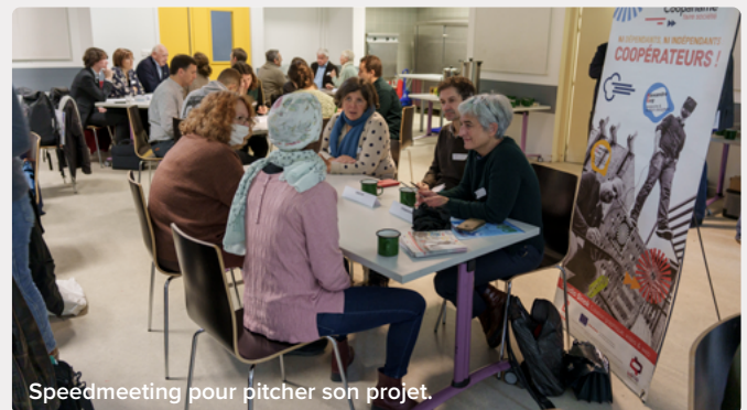
Speedmeeting pour pitcher son projet.

En apportant un regard extérieur, nous aidons la structure à reformuler sa vision stratégique, son projet associatif (95% des structures que nous accompagnons sont des associations) et les missions sur lesquelles elle va se recentrer et se concentrer.