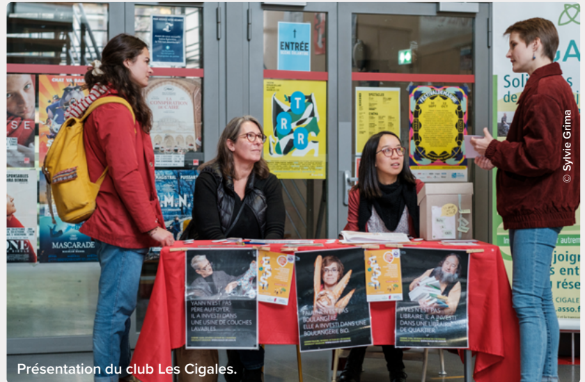
Présentation du club Les Cigales.

Les projets doivent avoir une dimension environnementale ou sociale et un impact local pour les citoyens. Ils peuvent être portés par des entreprises comme des associations. Chaque club peut avoir sa philosophie d'investissement, certains privilégient par exemple les projets environnementaux, d'autres les coopératives. Il ne faut pas hésiter à venir nous voir en amont, même si le projet n'est pas complètement ficelé. Nous avons des compétences parmi les Cigaliers (juridiques, financières...) et pouvons accompagner. Nous sommes d'abord un mouvement citoyen.