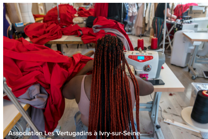
Association Les Vertugadins à Ivry-sur-Seine.

Des ateliers thématiques, des événements de mise en relation, du conseil personnalisé, une newsletter, une équipe dédiée