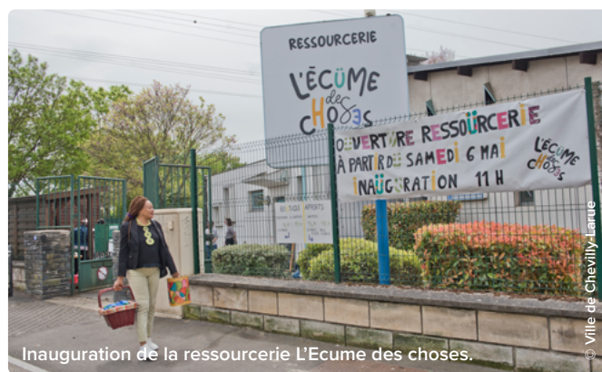
Inauguration de la ressourcerie L'Ecume des choses.